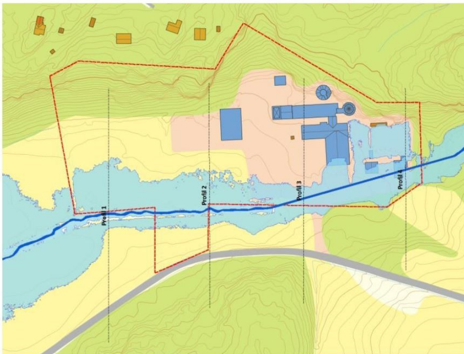
Figur 1 Oversvømt område ved Søndre Follo renseanlegg Q1000

I planforslaget er det foreslått å åpne bekken i full lengde (se vedlegg 6 – Bekkeåpning).